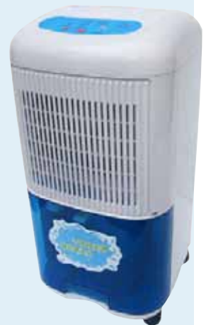
*los deshumidificadores se pueden comprar o alquilar