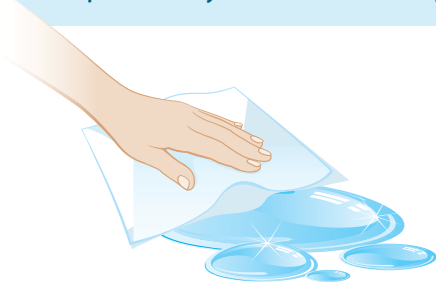
Limpie inmediatamente los derrames y desbordes.

Por lo general, el moho se puede encontrar en los baños, sótanos, las cocinas y los áticos. El moho crece en superficies y artículos del hogar que han estado húmedos durante más de 24 horas.