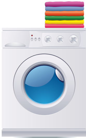
Almacene ropas y toallas limpias y secas. NUNCA deje ropa húmeda en la cesta de la ropa sucia o en la lavadora.